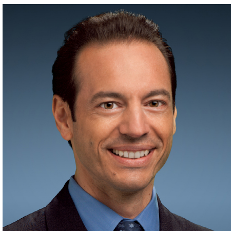
Gianluca Romano 首席财务官

请勿使用重大非公开信息买卖证券（例如，Seagate 股票或债券）。请勿将重大非公开信息传递给他人，以防止他人买卖证券。Seagate 团队成员只能将机密信息用于商业目的。“重大”信息是普通人在决定购买、出售或持有证券时认为重要的信息。